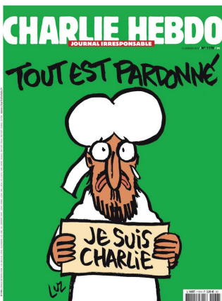
Une de CHARLIE HEBDO du 14 janvier 2015