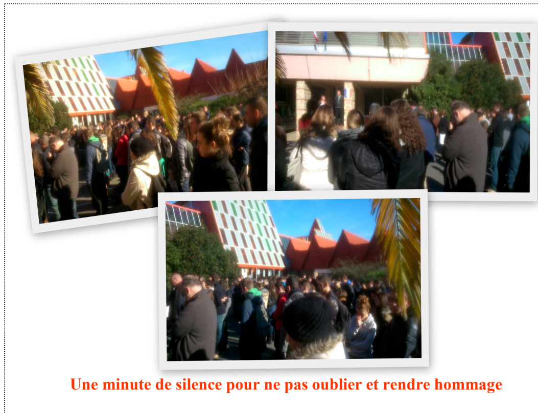
Une minute de silence pour ne pas oublier et rendre hommage